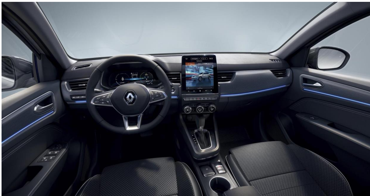
Tableau de bord numérique

Avec son intérieur et son poste de conduite high-tech qui met l'accent sur la qualité et le confort et son habitabilité sans compromis malgré sa ligne fuyante, Nouvel Arkana propose le meilleur accueil pour tous les occupants.