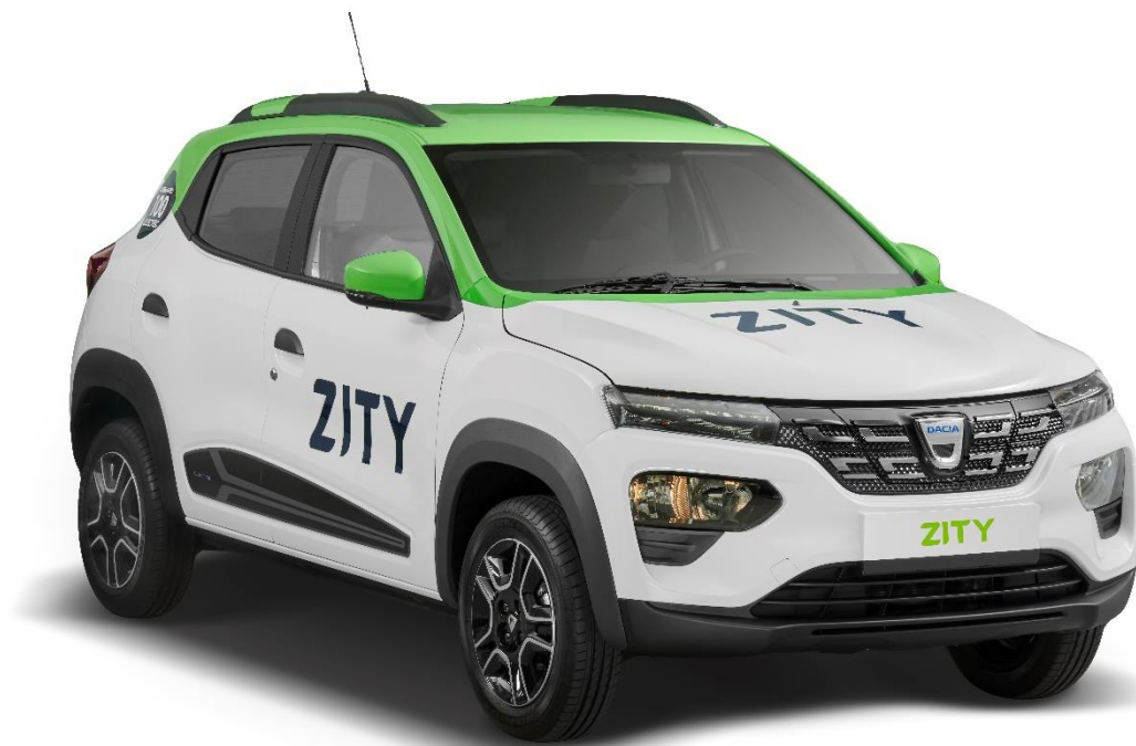
Dacia Spring, la petite nouvelle de la flotte ZITY by Mobilize