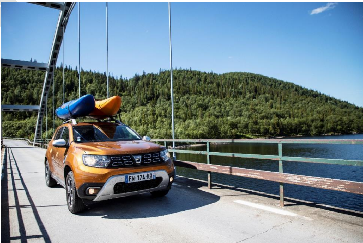
Duster en route pour déposer les kayaks...