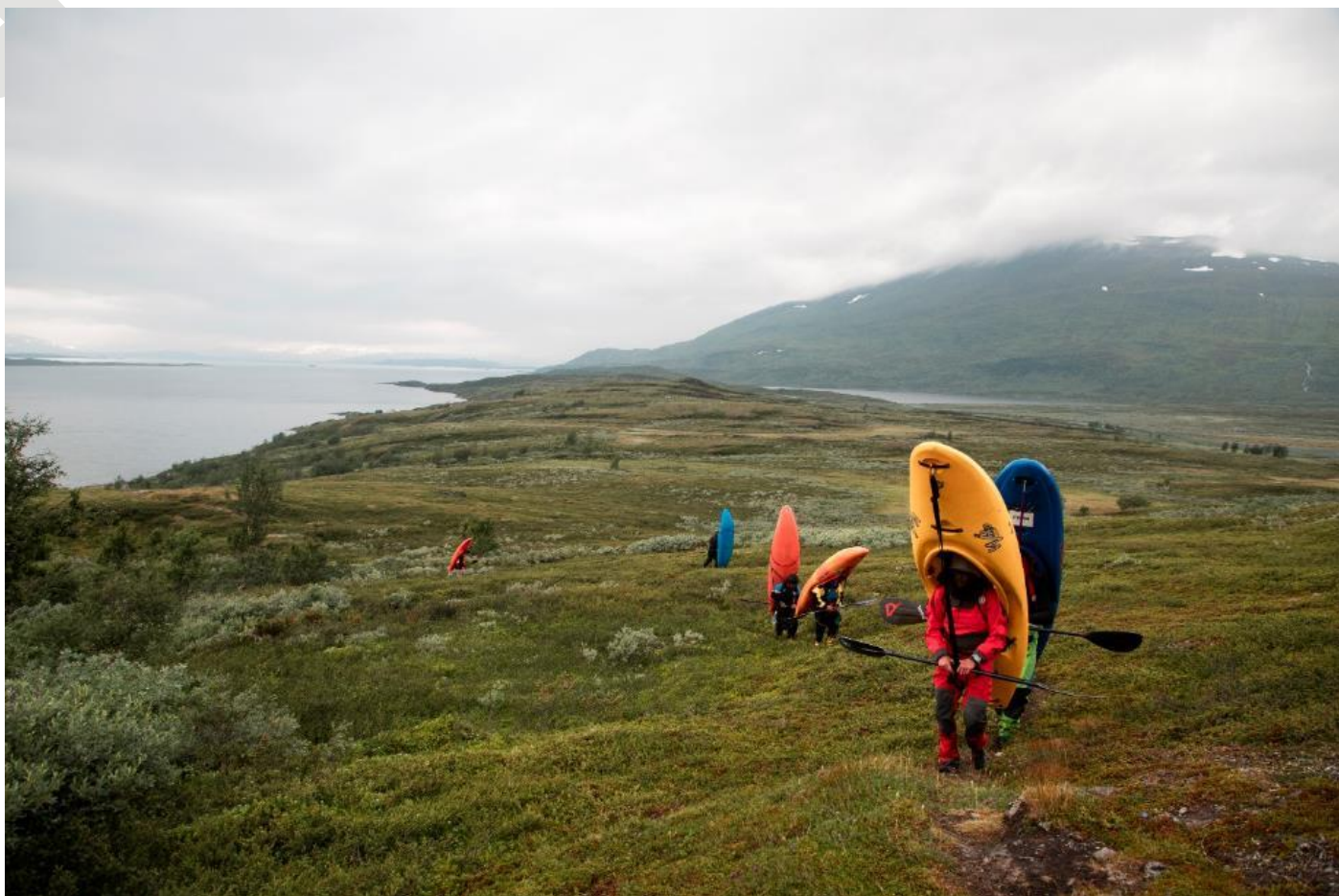
Chargés chacun d'une vingtaine de kilos, kayak sur le dos, les sportifs s'enfoncent dans la nature sauvage laponienne.