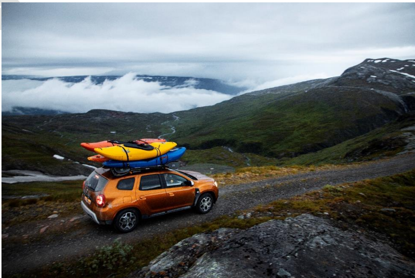
... en éclaireur dans le parc naturel de Padjelanta.