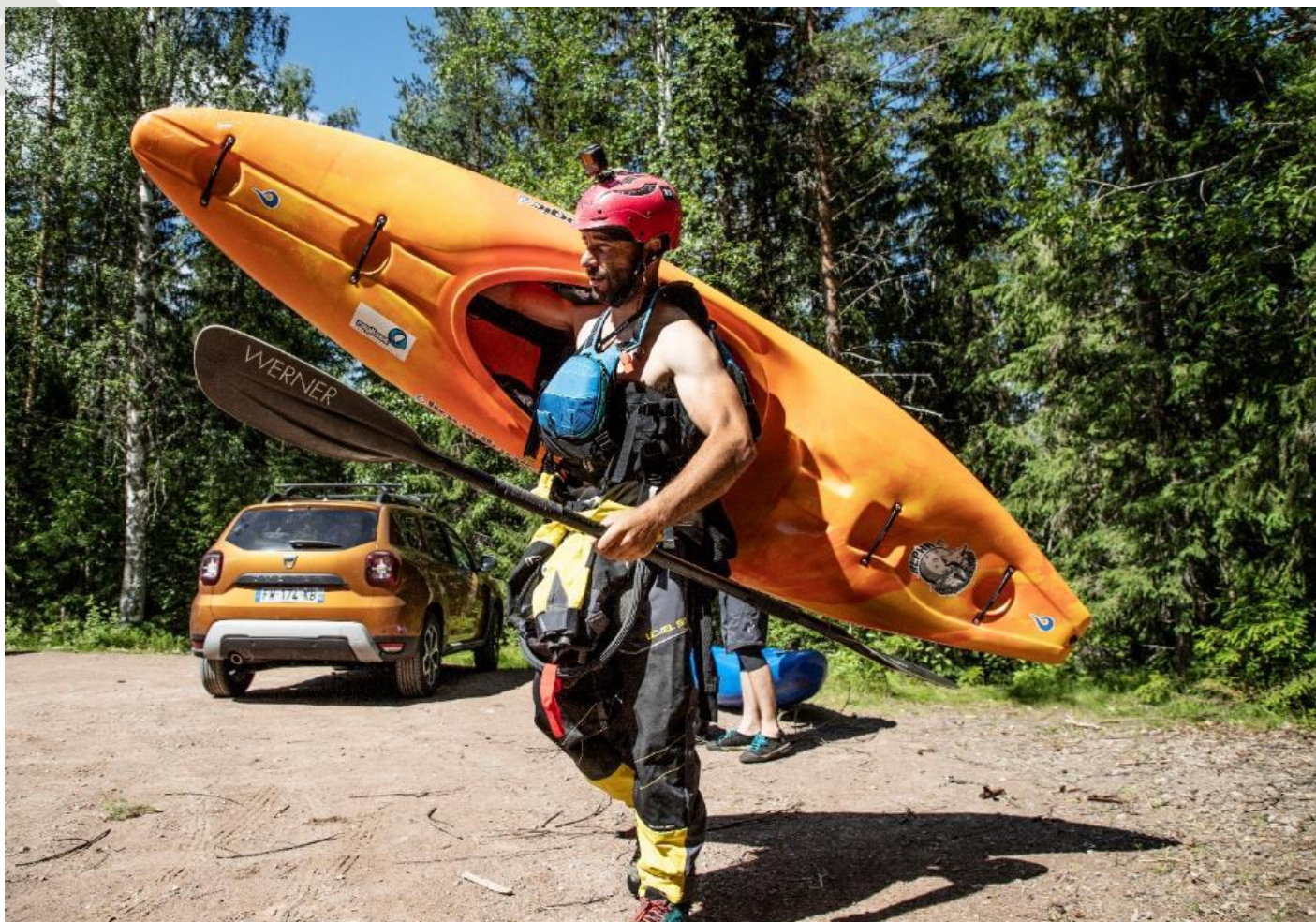
Duster assure les « navettes » pour mettre les kayaks à l'eau et les récupérer.