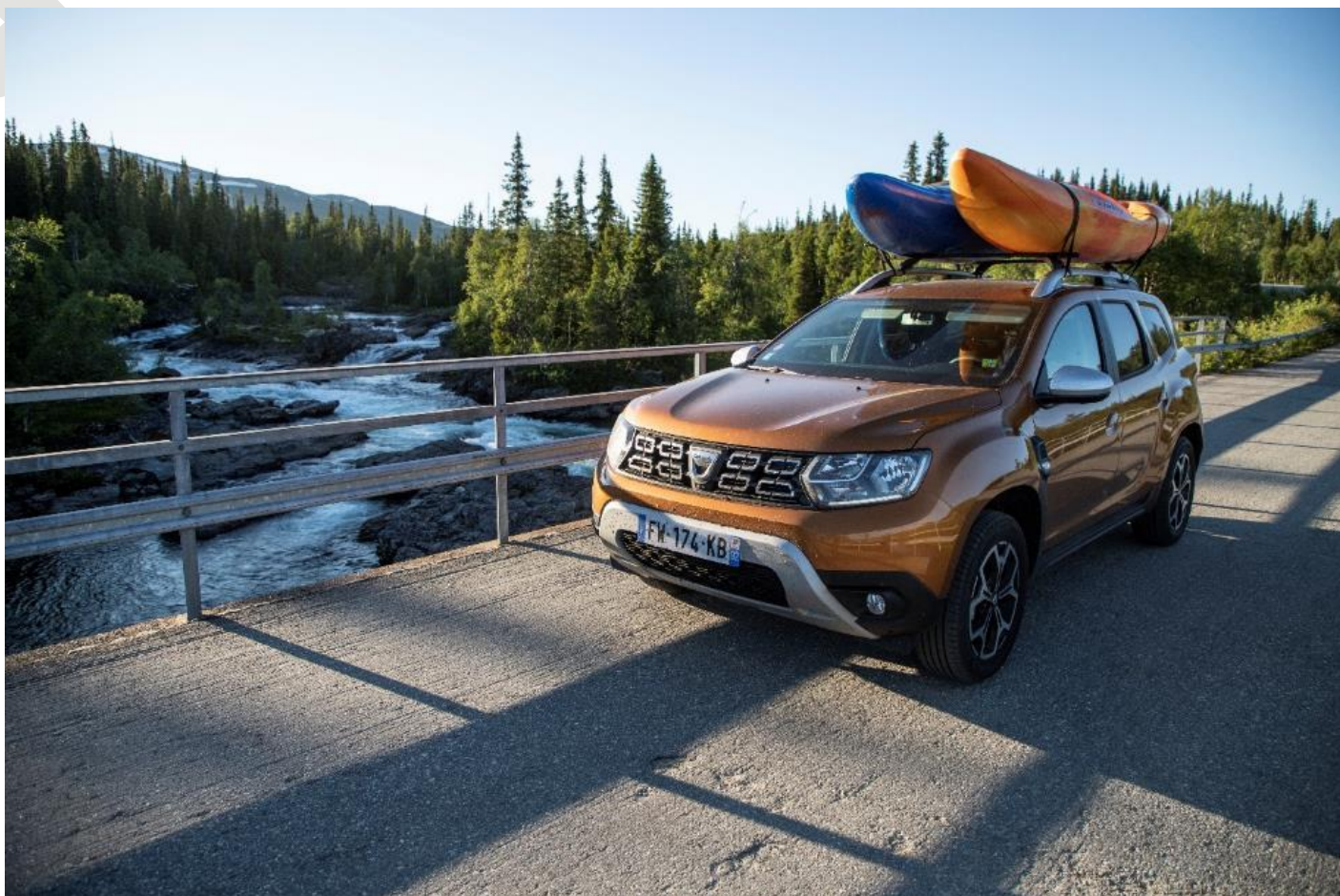
Les premiers rapides laponiens croisés en Dacia Duster. Les choses se précisent !