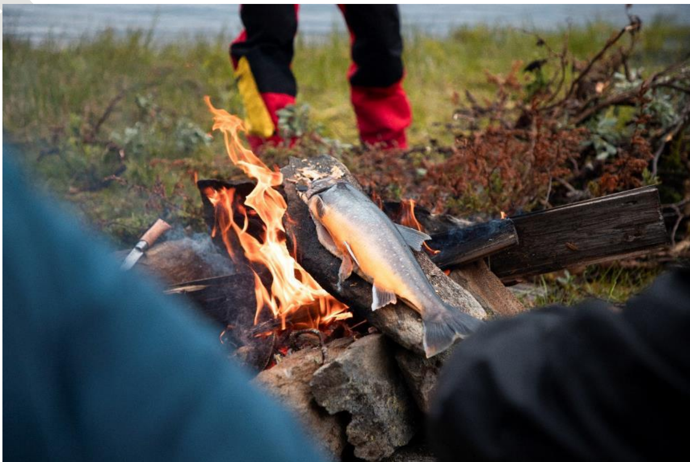
En bivouac, la pêche permet de compléter les repas lyophilisés emportés par les sportifs explorateurs