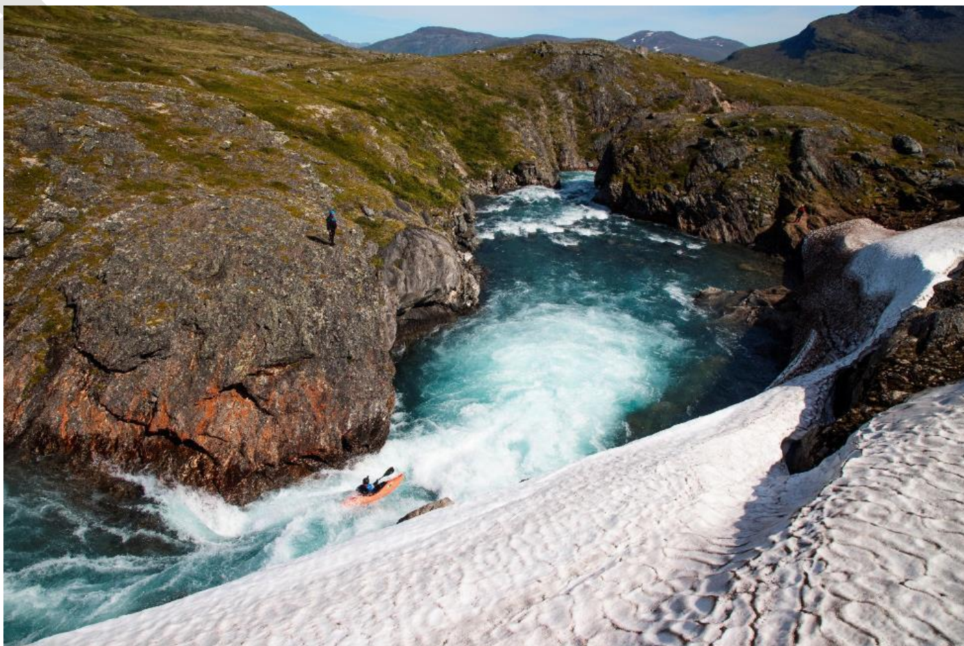
La Laponie se dévoile, somptueuse.