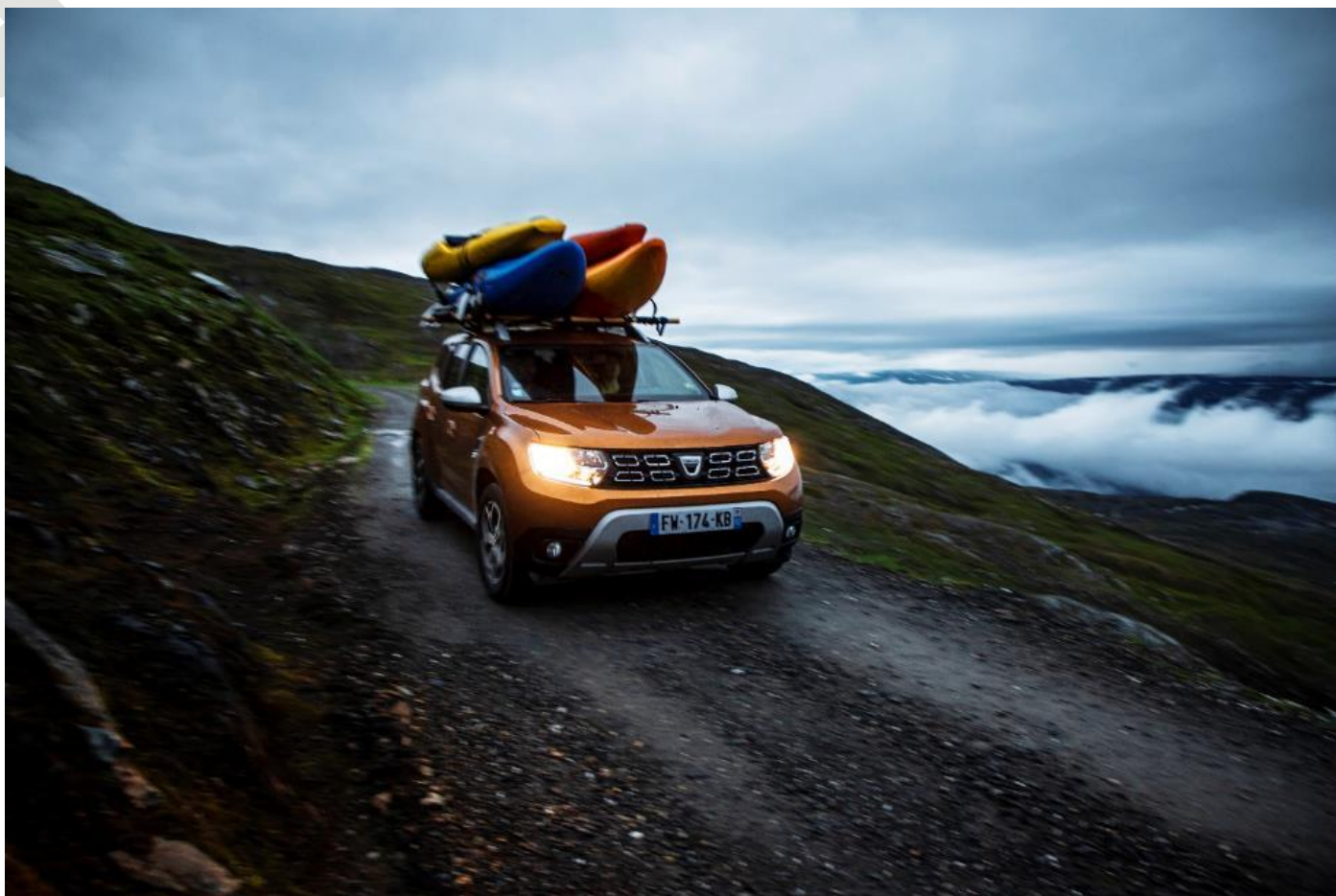
Duster sur piste, kayaks sur le toit...