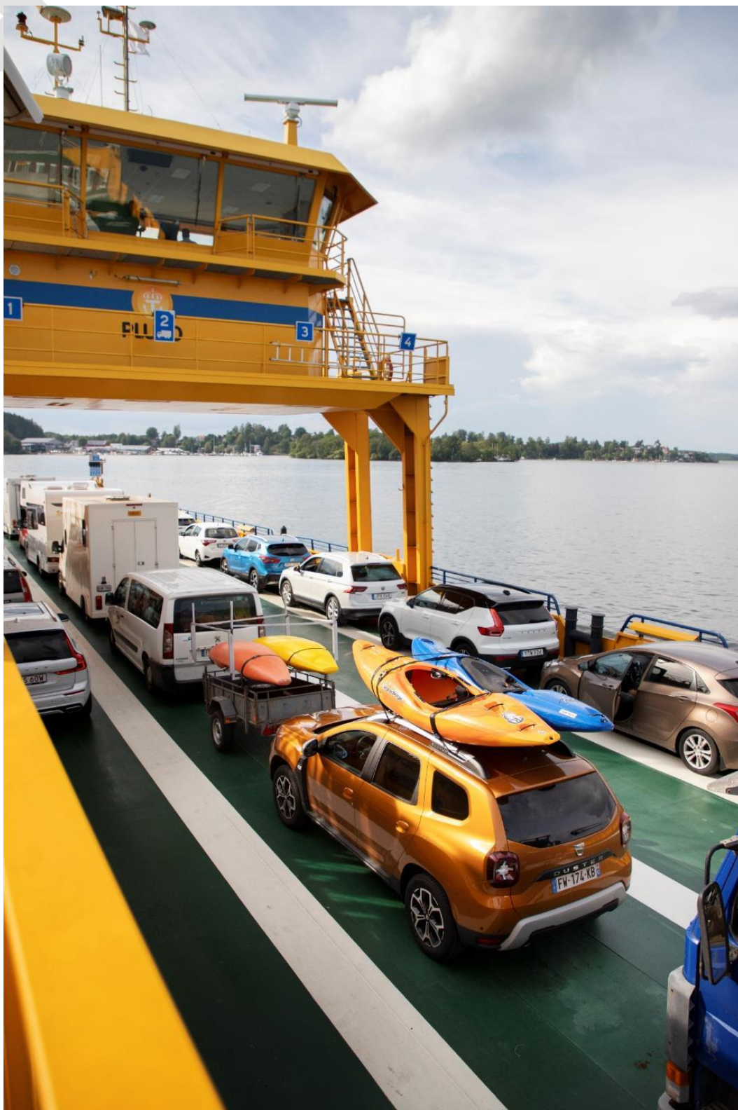
Dacia Duster, sur le ferry, direction la Suède.