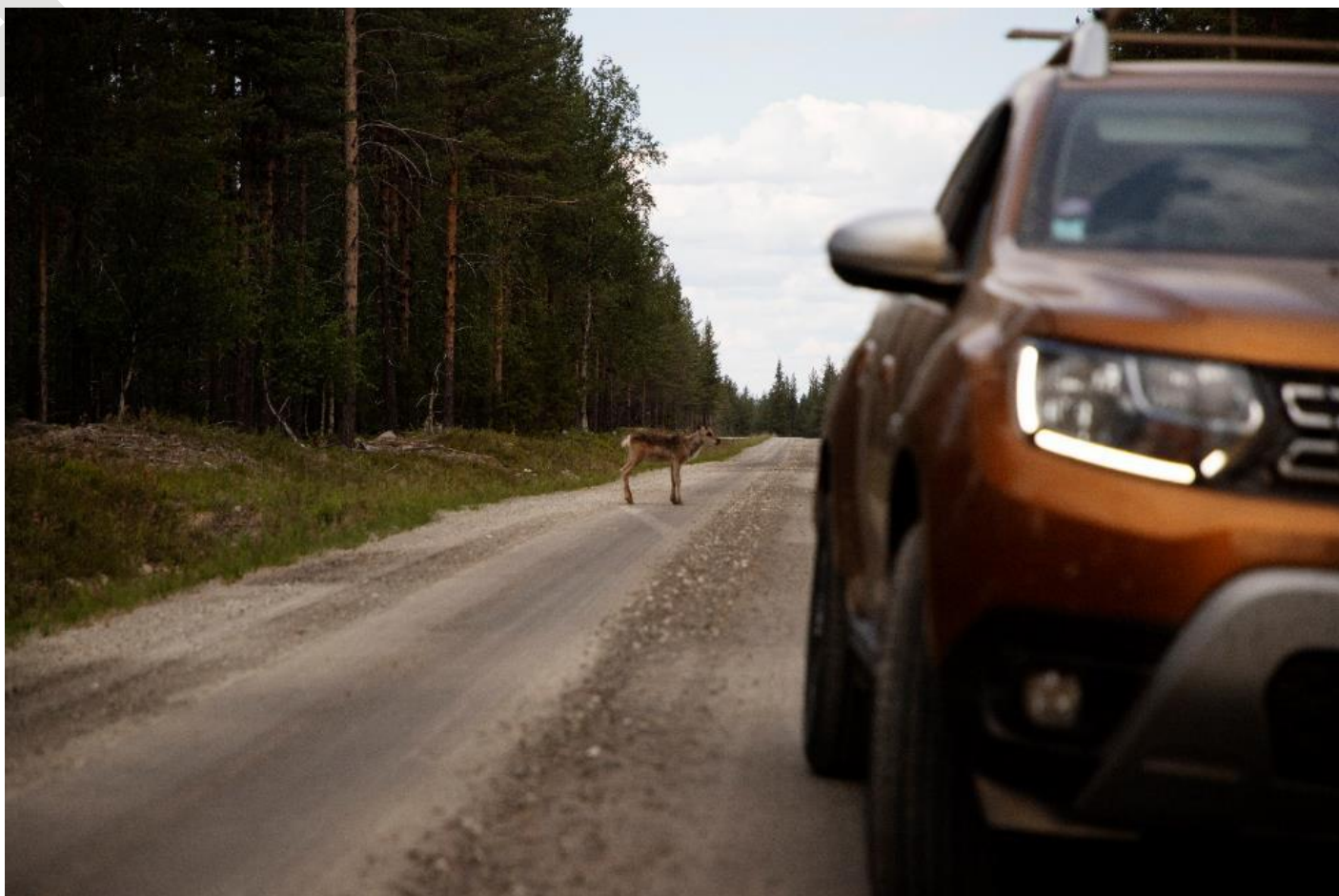
Les athlètes croisent les premiers rennes. C'est officiel : ils sont bien en Laponie !

Le roadtrip est rythmé par des nuits à la belle étoile et des arrêts en rivière pour pêcher et tester les équipements. « Les premières rivières étaient déjà incroyables mais plus on s'enfonçait dans cette nature sauvage plus c'était grandiose. Là, l'expédition prenait toute sa dimension ».