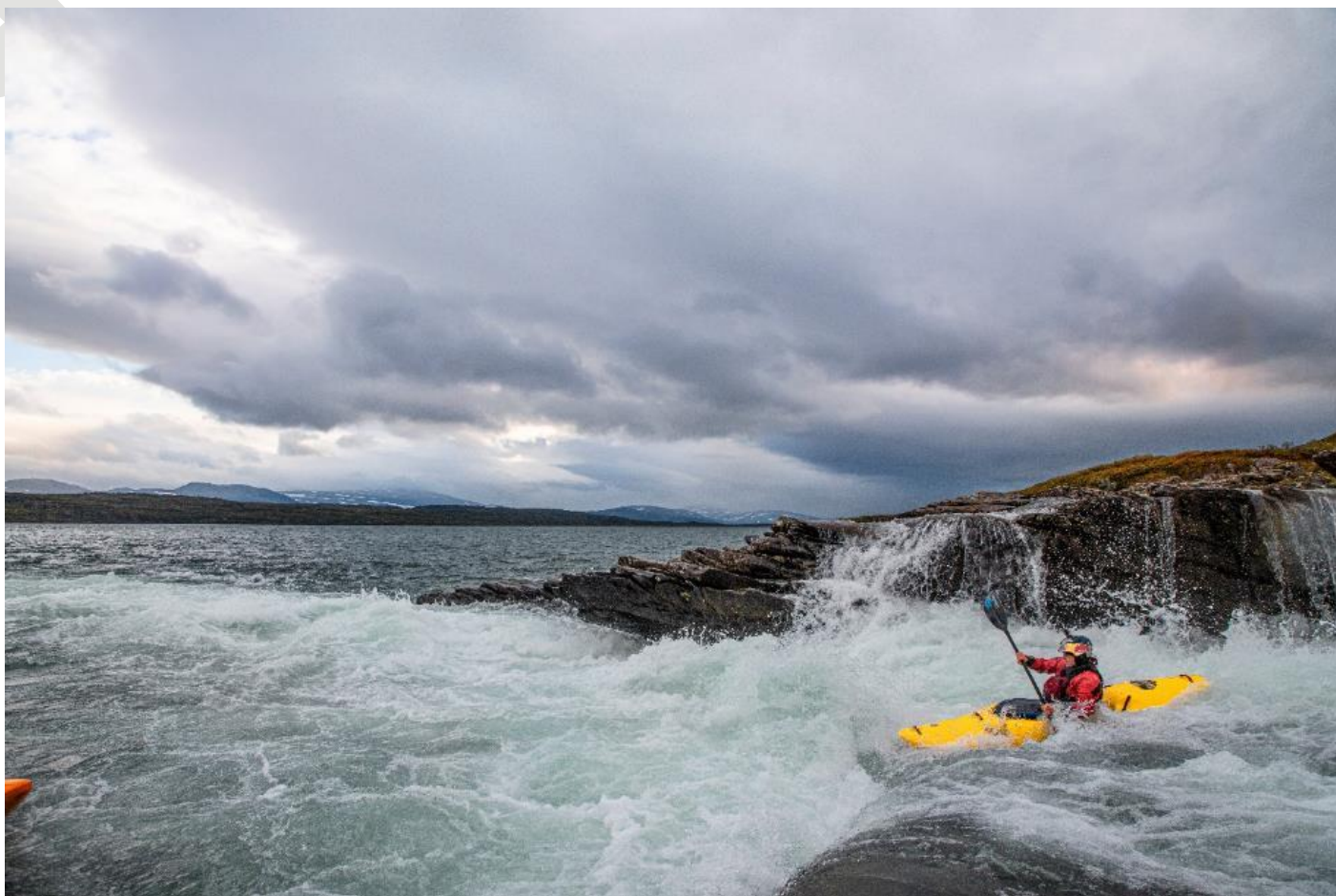
Nouria Newman sur le lac Vastenjaure.

Malgré l'adversité, la bande de copains est comblée. « On a rencontré tous les types de rivière qu'on puisse espérer rencontrer dans une vie de kayakiste ». Les nombreux rapides leur offrent les sensations attendues. Notamment le dernier avant d'arriver sur le lac de Ritsem. Un rapide « génial » large de plus de 100 mètres avec un débit de près de 300 m 3 par seconde !