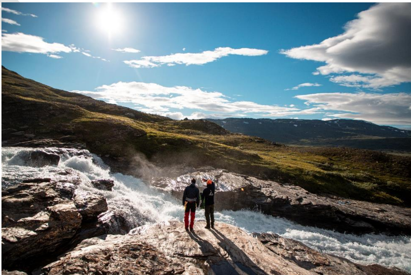
Les athlètes, méthodiques, effectuent des repérages...