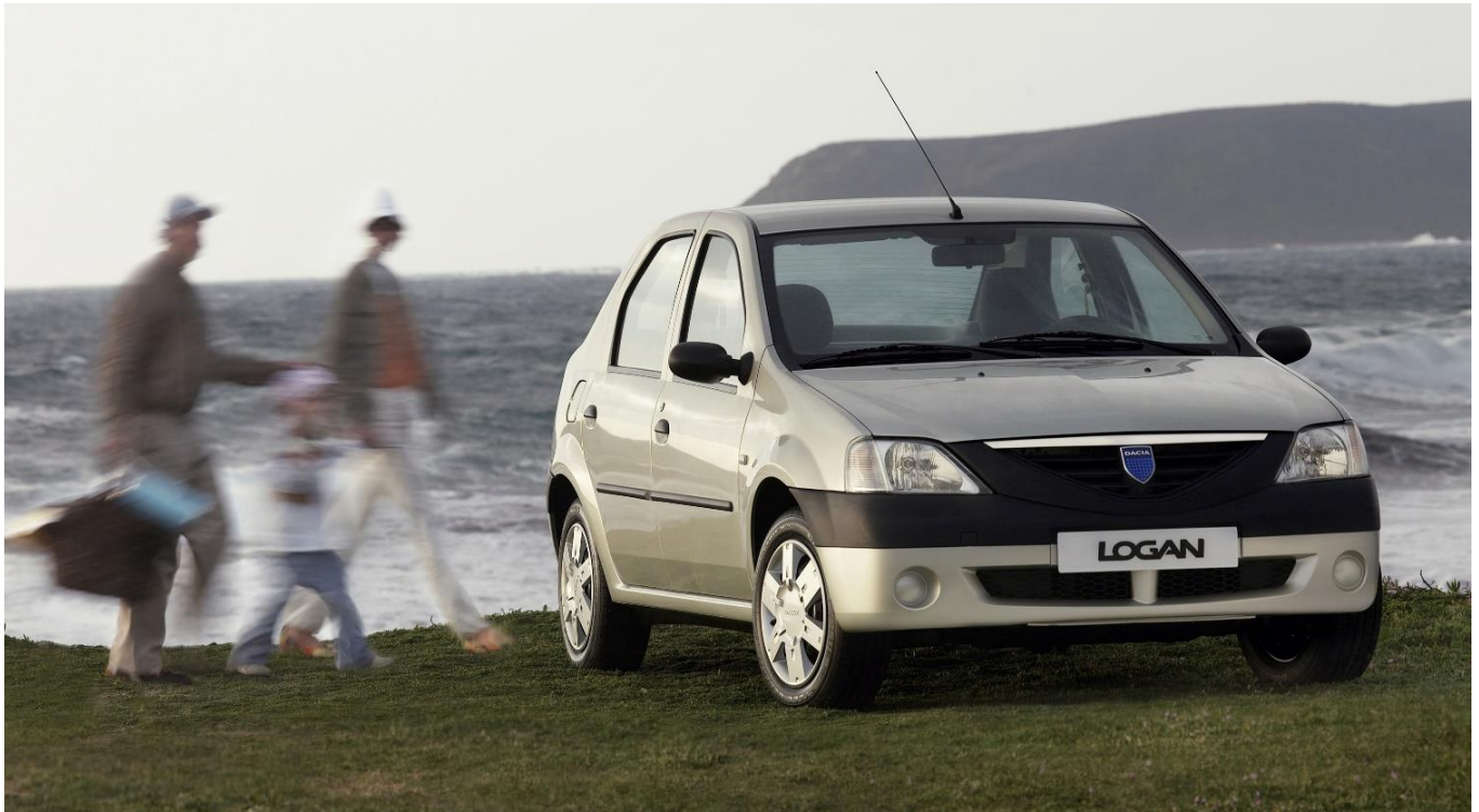
Dacia Logan, une révolution sociétale : l'accès à un véhicule neuf au prix de l'occasion