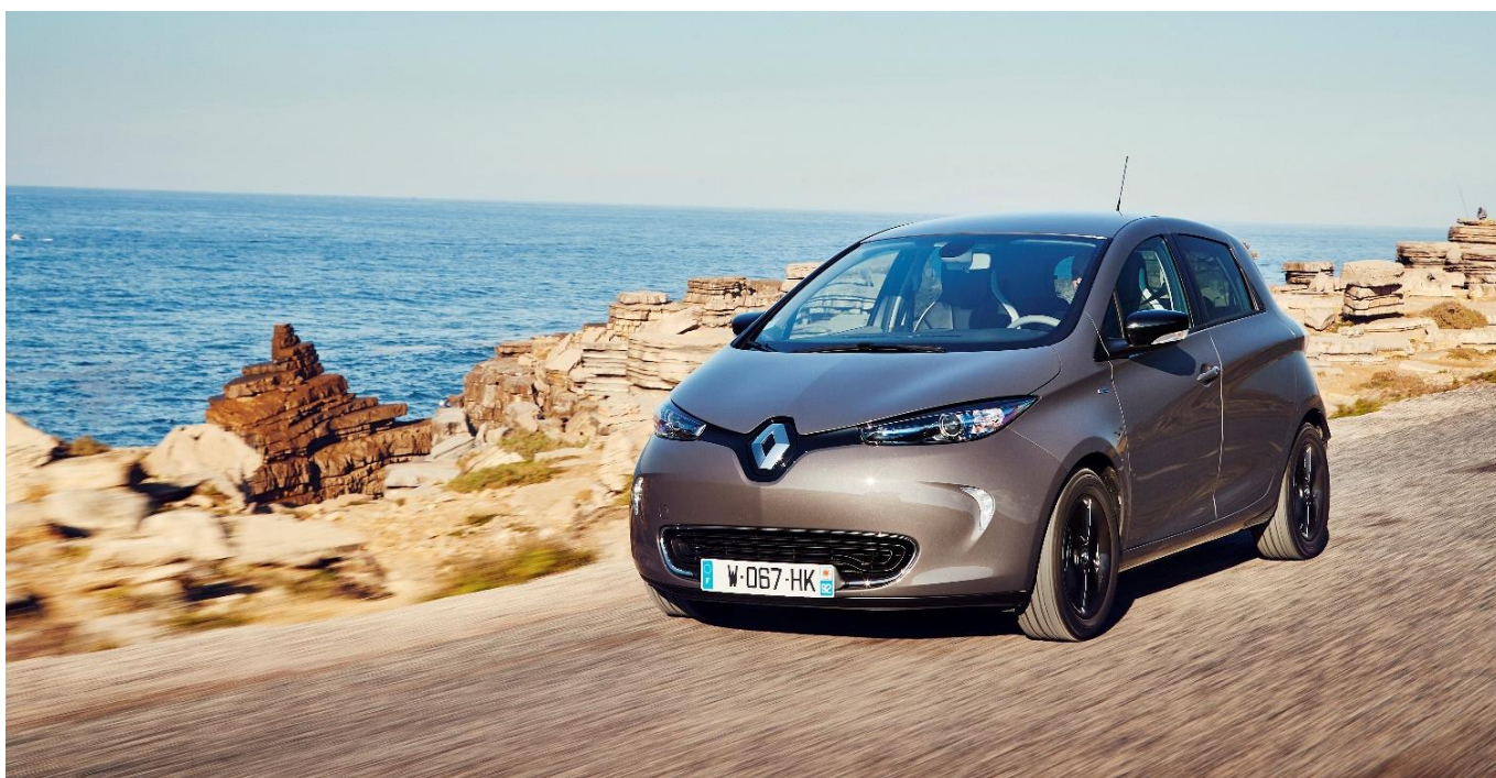
Renault ZOE, incarnation des aspirations sociétales pour une mobilité plus propre et plus responsable