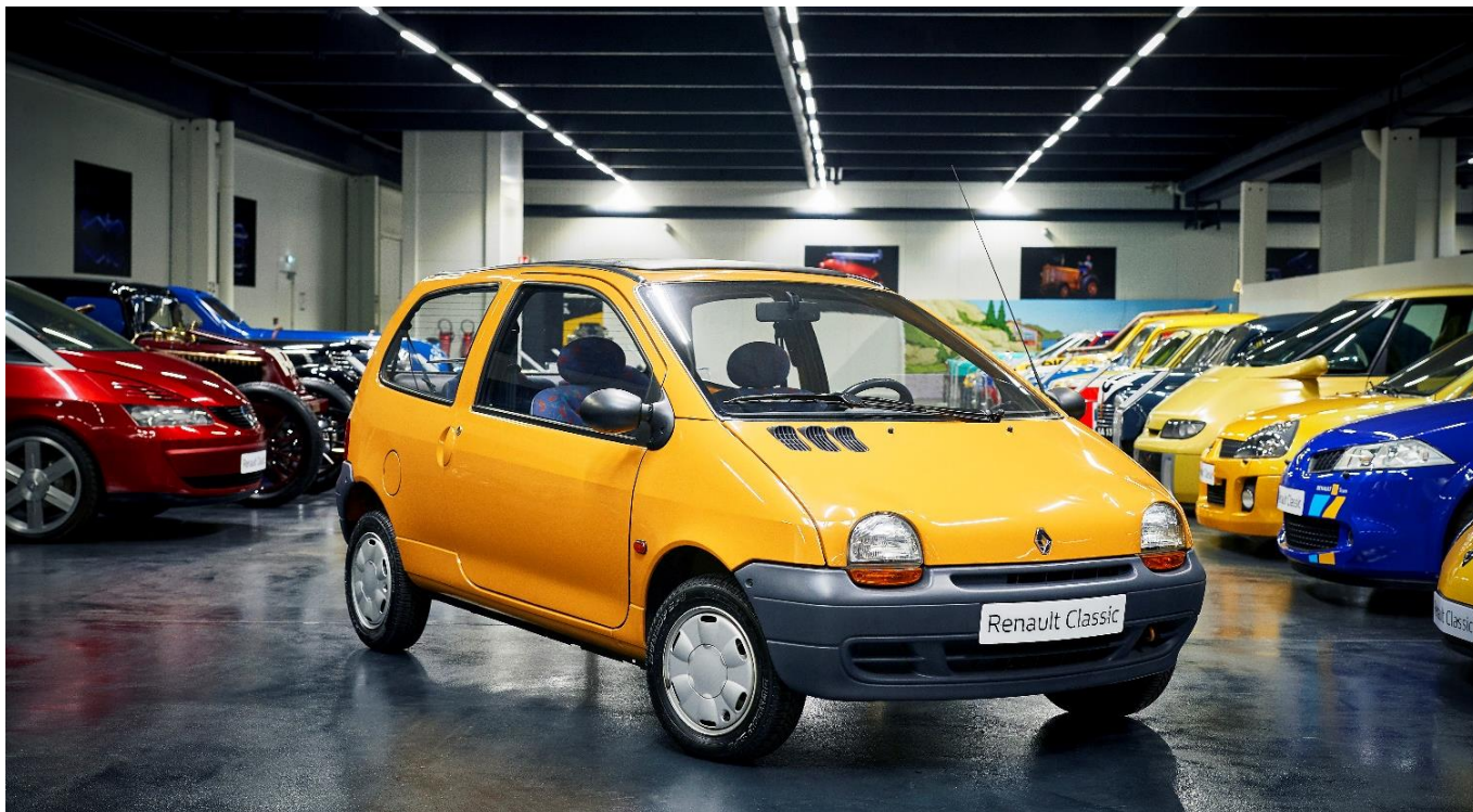
Renault Twingo, un « produit sociétal » en phase avec les attentes des consommateurs