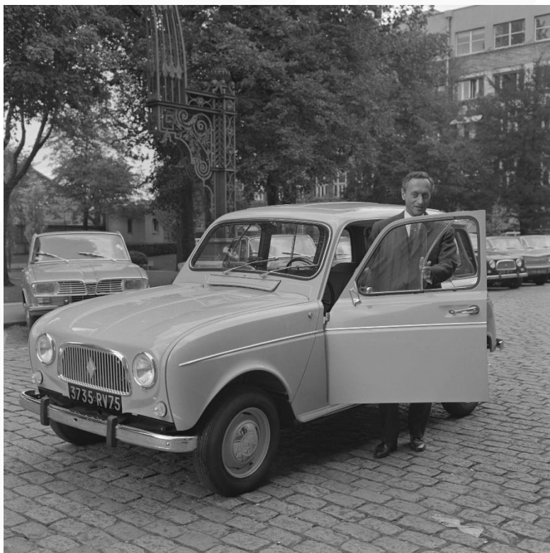
Pierre Dreyfus, patron de la régie Renault de 1955 à 1975 devant la Renault 4