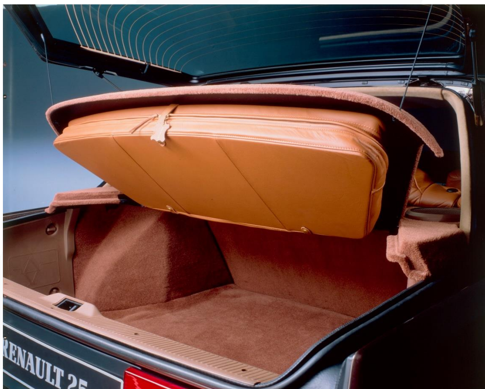
La Renault 25 Baccara proposait une housse à vêtements sous la plage arrière de son hayon

En fait, le hayon est applicable sur tous les modèles de voiture, aussi bien sur les berlines que sur les coupés et les citadines. Débute alors chez Renault le développement d'une vaste gamme de modèles à hayon comme les R20 et R30, la Fuego, la R25, la R11, etc. Le hayon va même connaître son petit moment de gloire lors du Paris-Dakar de 1982, remporté par les frères Marreau à bord d'une Renault 20.