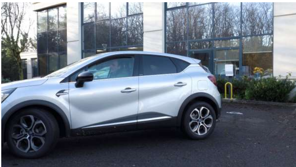
Les salariés en déplacement peuvent se charger dans les agences du groupe.

Car Qualiconsult compte bientôt couvrir l'ensemble de ses agences avec l'infrastructure de charge mise en place par Mobilize Power Solutions. Ce maillage pourra ainsi permettre à un salarié en déplacement depuis Paris vers Marseille, de recharger son véhicule sur son trajet, par exemple à l'agence de Valence. Un vrai plus quand on sait que le réseau des bornes de recharge publiques, notamment les bornes de recharge rapide des stations d'autoroute doit encore être développé.