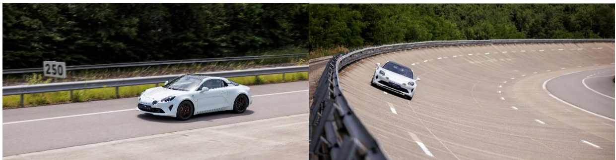
Auf dem Geschwindigkeitsring können die Fahrzeuge bis zu 250 km/h erreichen.

Als Nächstes kommen wir zum Speed-Ring. Wie der Name schon sagt, wird hier die Höchstgeschwindigkeit auf der Rennstrecke ausgefahren. Die Fahrer können den Motor auf bis zu 250 km/h beschleunigen, wobei in den Steilkurven 180 km/h erreicht werden, ohne das Lenkrad zu drehen. Alle aerodynamischen Tests werden hier durchgeführt. Eine Kuriosität ist jedoch besonders erwähnenswert. Auf dieser Strecke stehen 16 riesige Ventilatoren am Strassenrand und simulieren den Wind von 14 bis 72 km/h, um die Stabilität jedes Modells zu überprüfen und die Abweichung vom Kurs zu berechnen. Bei Nutzfahrzeugen wird aufgrund ihres hohen Gewichts ein elektronischer Ständer hinzugefügt, um die Stabilität auf der Autobahn zu erhalten. Übrigens: Wie auf einer echten Rennstrecke wird auf dem Speed-Ring gegen den Uhrzeigersinn gefahren. Linke Gehirnhälfte, Blutkreislauf des Herzens, Zentrifugalkraft, römische Tradition - es gibt so viele Legenden und Vermutungen, um eine Erklärung für dieses Phänomen zu finden. Sicher ist, dass (noch) niemand die genaue Antwort kennt. Aber so ist es nun einmal!