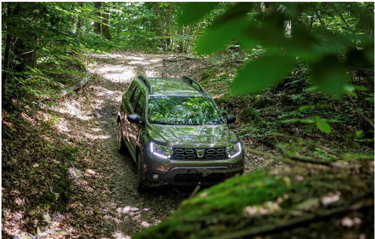
Traktionstest für den Dacia Duster auf einer Offroad-Piste

Und zur Abwechslung gibt es in Aubevoye natürlich auch Strecken mit starken Steigungen, Mittelgebirge-Simulation und Allradpisten, auf denen die verschiedenen Modelle, darunter auch Geländewagen, getestet werden können. Einige Beispiele: Mehr als 40 Meter Höhenunterschied für das Gebirge und ebenso viele Brückenkreuzungen, Bombenlöcher und vermessene Wege, um die stärksten Offroad-Gefühle zu erleben. Das Besondere an der Allradstrecke ist, dass die Entfernung völlig unbekannt ist. Und um zu den Testfahrten aufzubrechen, wird empfohlen, dass man sich nie allein auf den Weg machen oder (zumindest) gut ausgerüstet sein sollte! Auf diesen Pisten wird die Traktion der verschiedenen Allrad-Modelle auf eine harte Probe gestellt. Eine weitere schöne Kuriosität? Auf der Landstrasse, an steilen Hängen und im Mittelgebirge gibt es genauso viele Links- wie Rechtskurven.