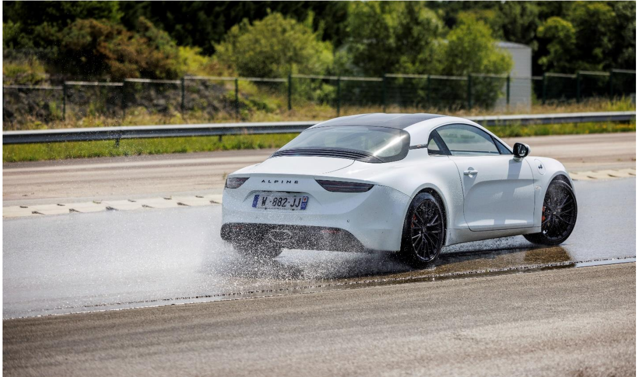
Der Alpine A110 S wird auf der Strecke für das Nassverhalten getestet