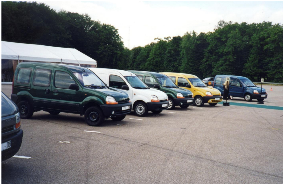
Zahlreiche Ausstellungen wurden in all den Jahren am Standort Aubevoye organisiert