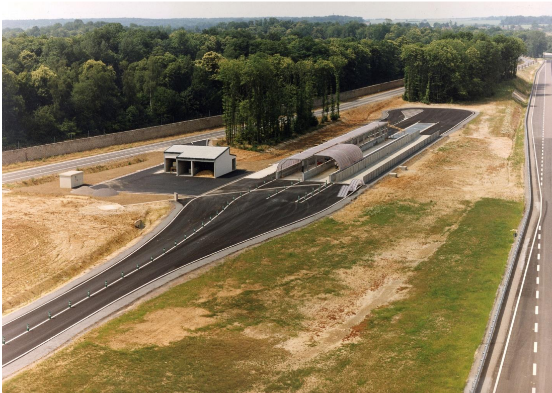
1995: Bau von 13 weiteren Strecken in Aubevoye wie Stadtzentrum, Synthetische Komfortstrecke, Schnellstrasse, bewässerte Strecke, Allwegstrecke