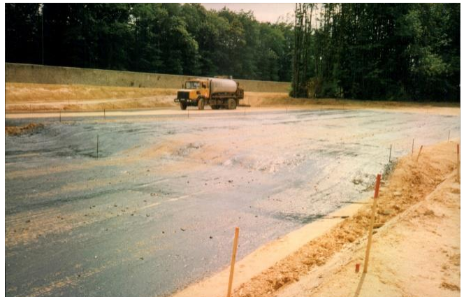
Die ersten Strecken wurden 1982 angelegt - Geschwindigkeitsring, Verhaltenspiste, Evolutionsbereich, Arbeitspiste etc.