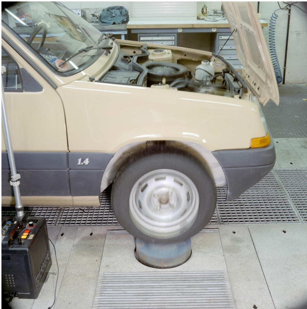
Die ersten Rollenprüfstände wurden 1983 installiert, um Verbrauch- und Abgaswerte vor der Zulassung durchzuführen; seitdem wurden zahlreiche Renovierungen, Änderungen und Ersetzungen vorgenommen.