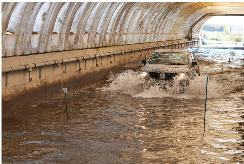
Die Wasserfurt stellt die klimatischen Bedingungen in Ländern mit starken Regenfällen nach.

Auf den Teststrecken von Aubevoye findet man ebenso viele Kuriositäten wie es Kilometer gibt. Während dynamische Tests zur Überprüfung des Fahrverhaltens von entscheidender Bedeutung sind, sind statische Tests in der Konzeptionsphase neuer Fahrzeuge unerlässlich. Im Technischen Center von Aubevoye sind in den zahlreichen Gebäuden Werkzeuge und Mittel untergebracht, von denen man sich nicht vorstellen kann, dass es sie gibt.