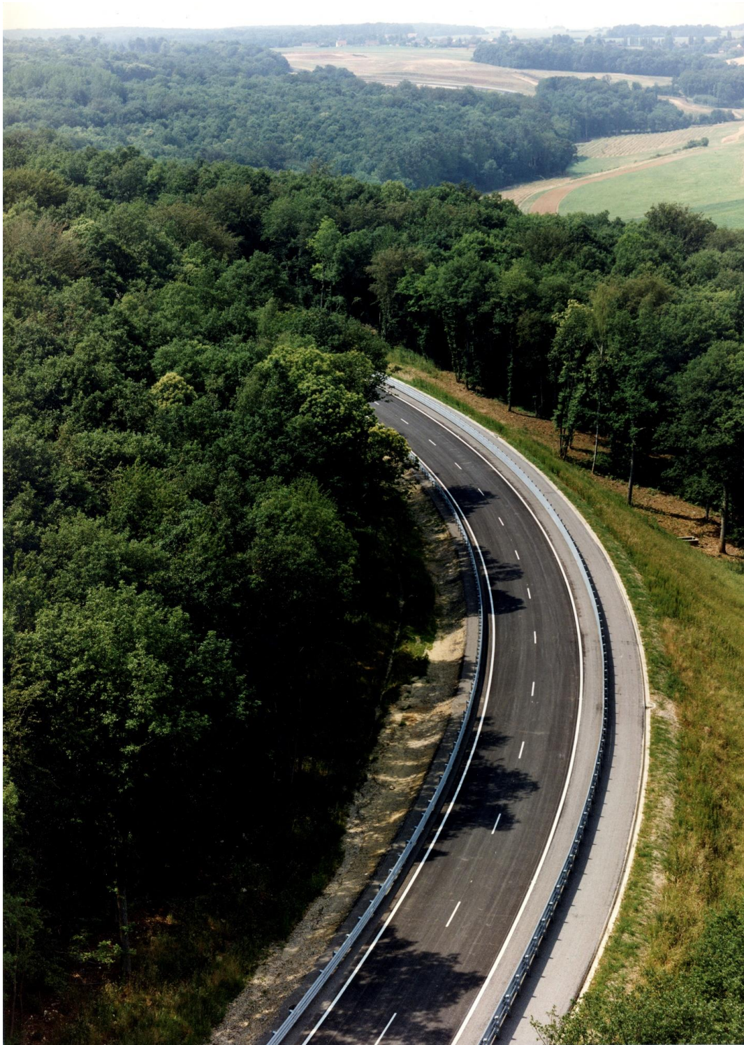
2000: Bau von starken Hängen, mittleren Bergen und der Nationalstrasse