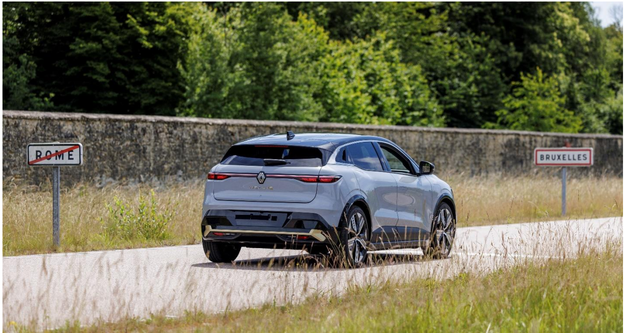
Der Mégane E-Tech Electric auf der "Innenstadt"-Strecke von Rom nach Brüssel.

Als Nächstes kommen wir zum Speed-Ring. Wie der Name schon sagt, wird hier die Höchstgeschwindigkeit auf der Rennstrecke ausgefahren. Die Fahrer können den Motor auf bis zu 250 km/h beschleunigen, wobei in den Steilkurven 180 km/h erreicht werden, ohne das Lenkrad zu drehen. Alle aerodynamischen Tests werden hier durchgeführt. Eine Kuriosität ist jedoch besonders erwähnenswert. Auf dieser Strecke stehen 16 riesige Ventilatoren am Strassenrand und simulieren den Wind von 14 bis 72 km/h, um die Stabilität jedes Modells zu überprüfen und die Abweichung vom Kurs zu berechnen. Bei Nutzfahrzeugen wird aufgrund ihres hohen Gewichts ein elektronischer Ständer hinzugefügt, um die Stabilität auf der Autobahn zu erhalten. Übrigens: Wie auf einer echten Rennstrecke wird auf dem Speed-Ring gegen den Uhrzeigersinn gefahren. Linke Gehirnhälfte, Blutkreislauf des Herzens, Zentrifugalkraft, römische Tradition - es gibt so viele Legenden und Vermutungen, um eine Erklärung für dieses Phänomen zu finden. Sicher ist, dass (noch) niemand die genaue Antwort kennt. Aber so ist es nun einmal!