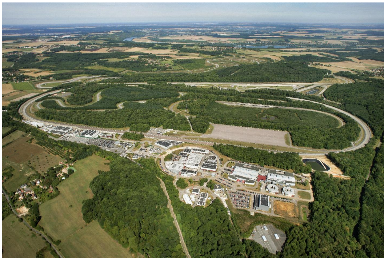
Luftaufnahme des Technischen Centers von Aubevoye (CTA)

Versteckt im Wald des Departements Eure, im Herzen der Seine-Schleifen durch die Normandie, liegt das Technische Entwicklungszentrum von Aubevoye (CTA), ein sonst geheim gehaltener Ort der Renault Group. Dieser als vertraulich eingestufte Standort prüft alle Prototypen der Konzernmarken, um ihre Entwicklung zu validieren. Hier werden die neuen Modelle vor ihrer Markteinführung zertifiziert, indem sie abwechselnd statisch und dynamisch getestet, optimiert und auf Ausdauer geprüft werden. Das CTA wurde 1982 erbaut und feiert heuer sein 40-jähriges Bestehen. Generationen von passionierten Frauen und Männern haben nacheinander die Geschichte eines ganzen Standorts, aber auch einer Region und einer Industrie geschrieben. Diese 40 Jahre, die von Hoffnungen und Schwierigkeiten, Anstrengungen und Erfolgen geprägt waren, sind der Stolz eines jeden Mitarbeiters/einer jeden Mitarbeiterin und erzählen die Geschichte der Modelle, die in Aubevoye ihre ersten Runden gedreht haben.