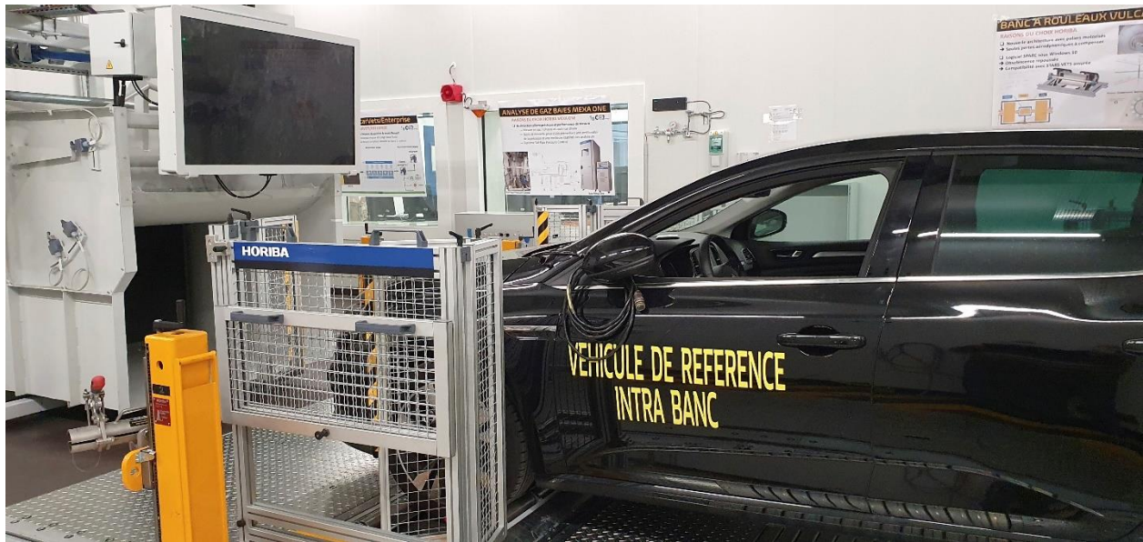
2020 - Inbetriebnahme einer neuen Klima-Konsum-Autonomiebank (-30 / +50C mit Sonnensimulation)