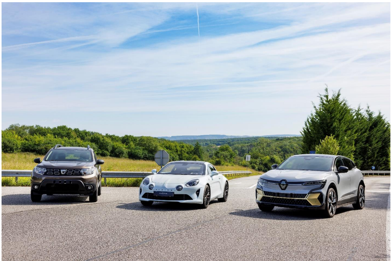
Alle Modelle der Renault Group werden im Technischen Center von Aubevoye getestet.

Hier haben nur Eingeweihte Zutritt. Aber um das 40-jährige Bestehen dieses Ortes zu feiern, laden wir Sie zu einem virtuellen Tag der offenen Tür ein, bei dem Sie viele Geheimnisse entdecken können!