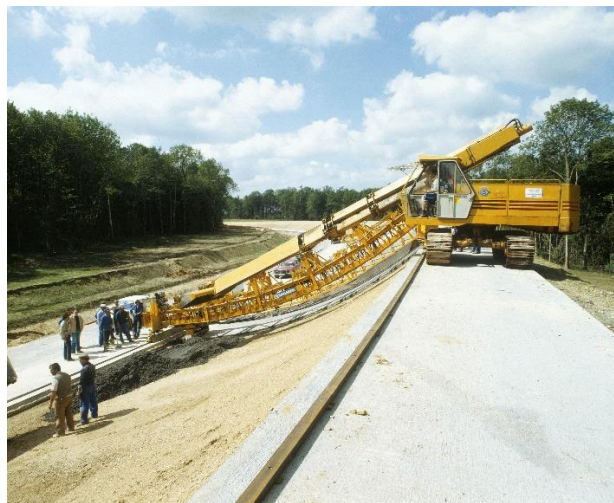
Das Technische Center von Aubevoye wird 1982 gebaut.