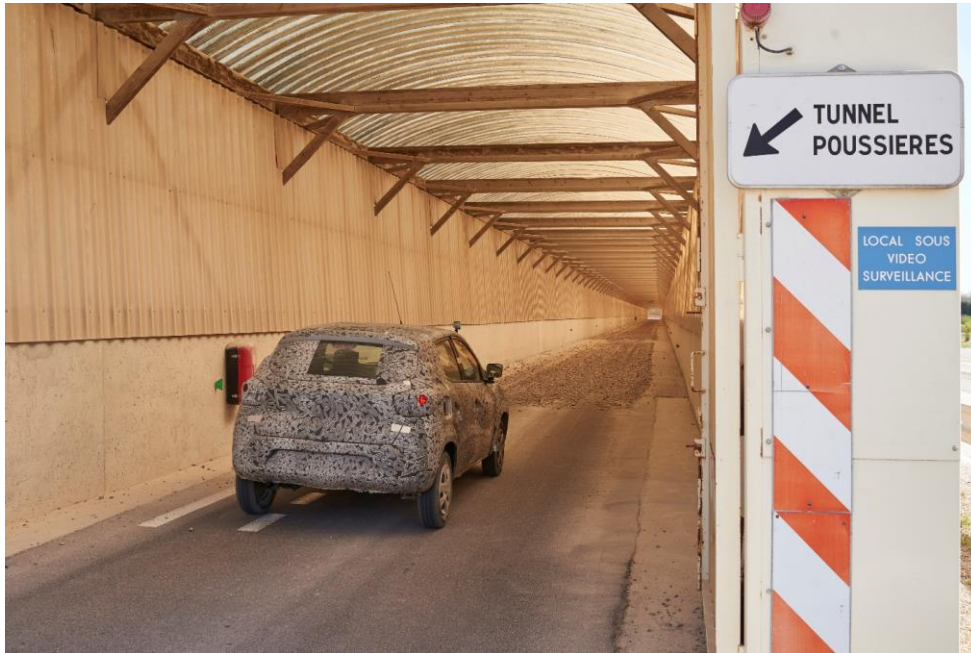
Der Staubtunnel repliziert die Bedingungen, die in Argentinien, einem Land mit einer sehr hohen Staubbelastung, vorgefunden wurden.