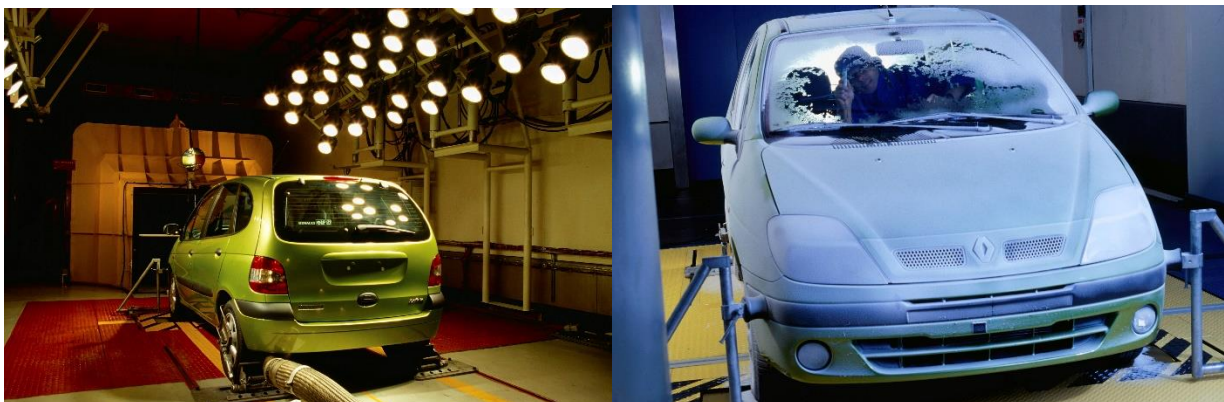
1993 - Entstehung der beiden Klima-Windkanäle, warm und kalt